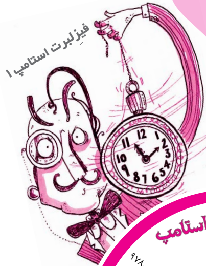
فیزلبرت استامپ ا