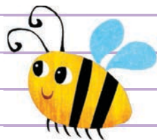
کلمه‌ی زنبورِ عسل