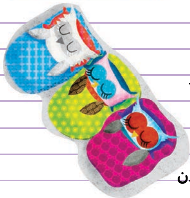
صبح، پیش دوست‌هایم خوابیدن