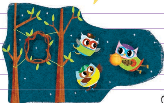
وینگبال بازی ۱