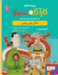
سال نوی چینی