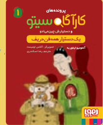
یک دستیار همه فن حریف