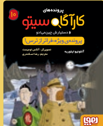
پرونده‌ی ویژه: فراتر از ترس