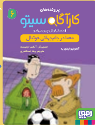
معما در جام جهانی فوتبال