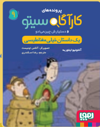
یک داستان خیلی مغناطیسی