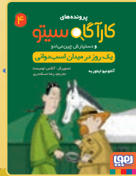
یک روز در میدان اسب‌دوانی