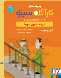
در جستجوی موها