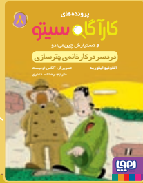
زردسرها در کارخانه‌ی چترسازی