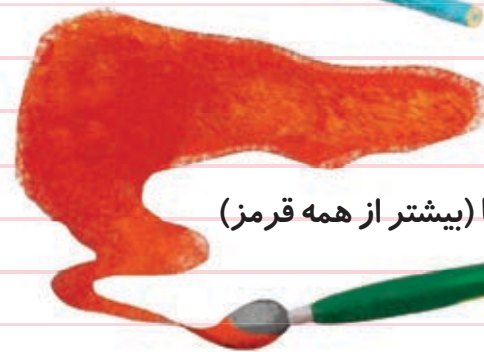
رنگ‌ها (بیشتر از همه قرمز)