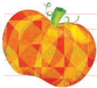
کلمه‌ی کدو تنبل