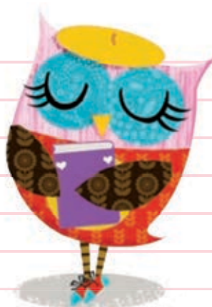
من عاشق این‌ها هستم: