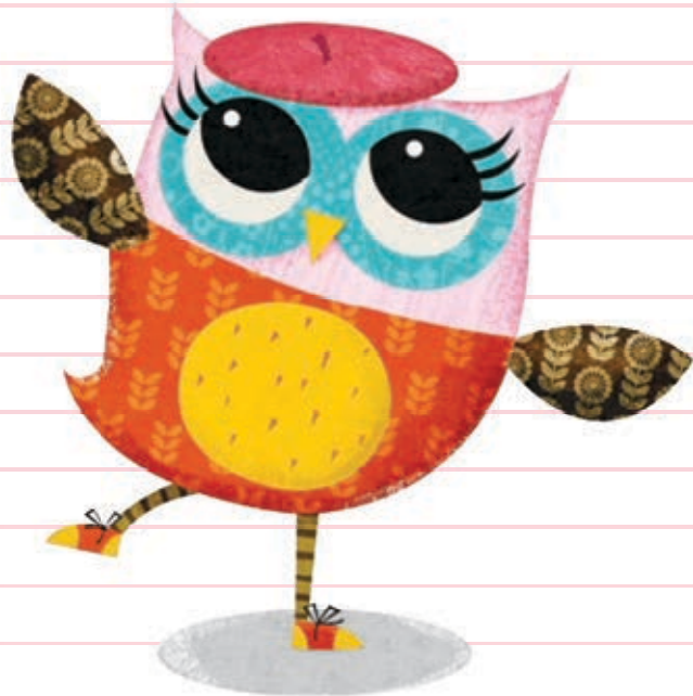
ریکا ایوت مترجم: سیدنوید سیدعلی اکبر