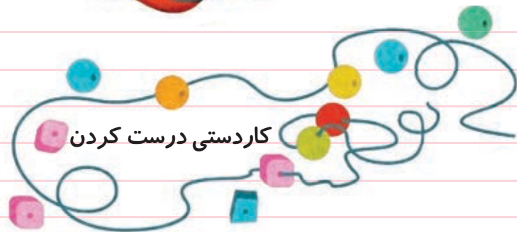
کاردستی درست کردن