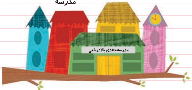
مدرسه جغدی بالادرختی