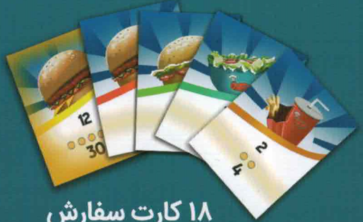
۱۸ کارت سفارش