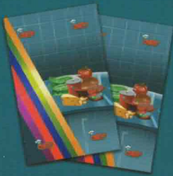
۲ کارت میکس