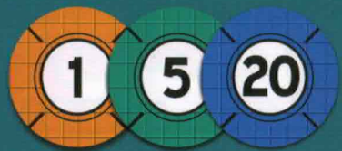
سکه‌ها با ارزش‌های ۱ و ۵ و ۲۰