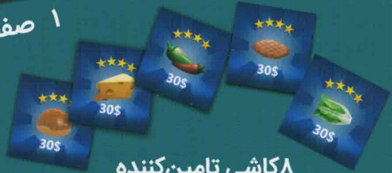
۸ کاشی تامین‌کننده