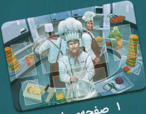
۱ صفحه‌ی بازی