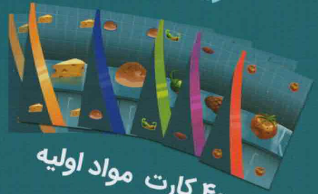
۴۰ کارت مواد اولیه