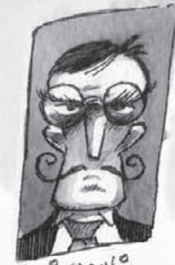
سایمون شومیان ۱۸۷۱ - ؟